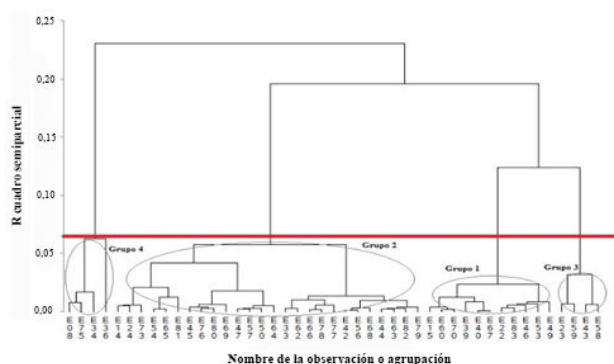
Figura 2. Dendrograma correspondiente al agrupamiento de los productores de maíz encuestados con énfasis en el manejo de enfermedades en el departamento del Meta, Colombia